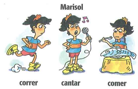
correr cantar comer

Le gusta bailar pero no le gusta correr. Le gusta leer pero no le gusta cantar. Le gusta nadar pero no le gusta comer mucho. ¿Qué actividades no le gusta hacer a Marisol?