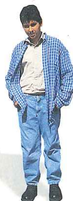
3. el chico