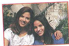
las chicas: guapas, divertidas y fenomenales

When an adjective describes a group with both genders, the masculine form of the adjective is used.