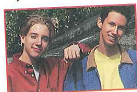
los chicos: guapos, divertidos y fenomenales

Adjectives must also match the number of the nouns they describe. To make an adjective plural, add -s if it ends with a vowel, -es if it ends with a consonant.