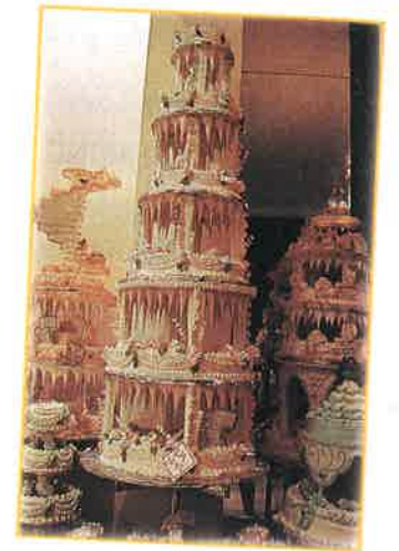
Un pastel para la quinceañera