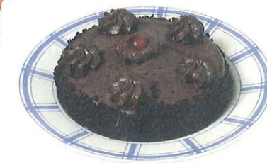
pastel / tarta / torta