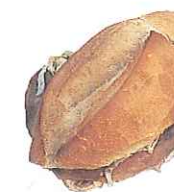
torta / bocadillo

In Mexico the word torta is used to describe a large sandwich on crusty bread. In Spain bocadillo is used. In other countries, torta usually means cake . In Mexico, the word pastel is used to mean cake . In Spain, tarta is used for cake .