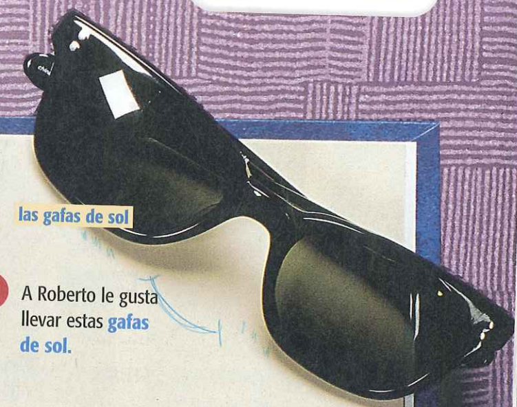
las gafas de sol

D La chica lleva una camisa con rayas . Es verano.