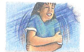
2. su prima