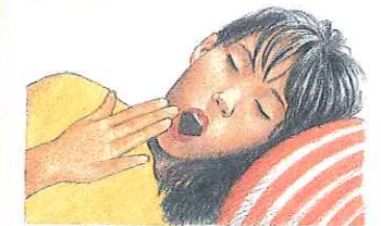
1. la amiga de Roberto

Hablar ¿Cómo se sienten estas personas? Describe cada dibujo, usando una expresión con tener . (Hint: Describe each picture with a tener expression.)