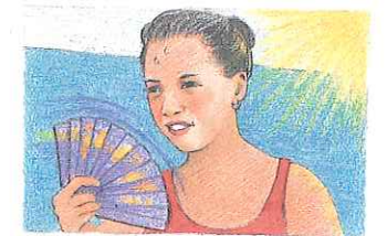
3. su hermana