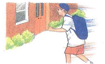
4. su vecino