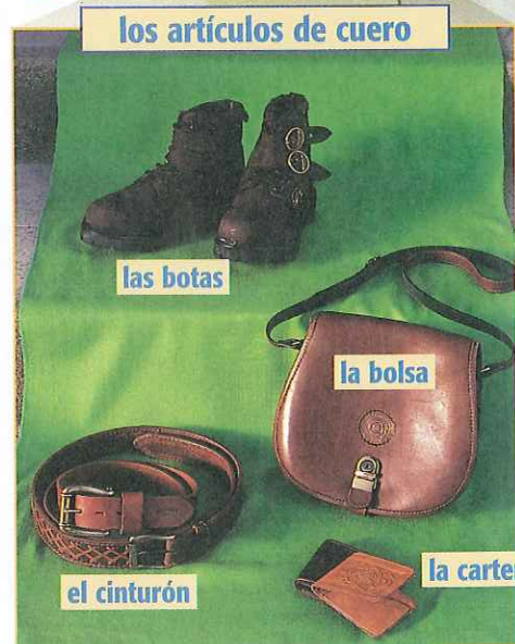
los artículos de cuero