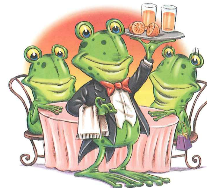
¡El sapo del centro sirve zumo sabroso!