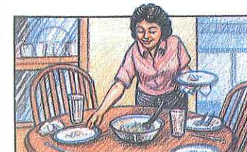
quitar la mesa