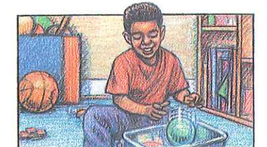
limpiar el cuarto