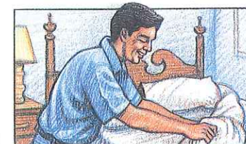
hacer la cama