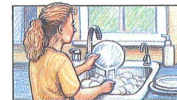
lavar los platos