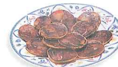
el chorizo sausage