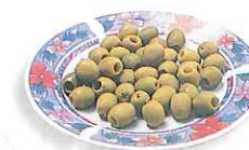
las aceitunas olives