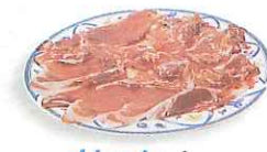
el jamón ham