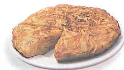
la tortilla española potato omelet

Las tapas son porciones pequeñas de comida. ¿Cuáles te gustan?