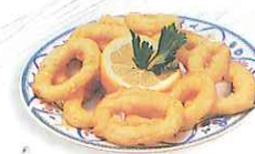
los calamares squid